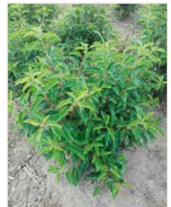
Prunus lusitanica Angustifolia