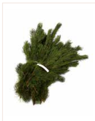
Pinus Strobus (Seidenkiefer)