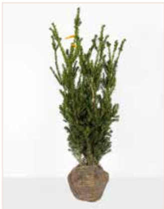
Taxus media Hilli