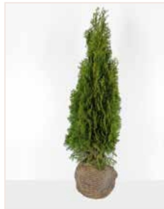
Thuja occidentalis Smaragd