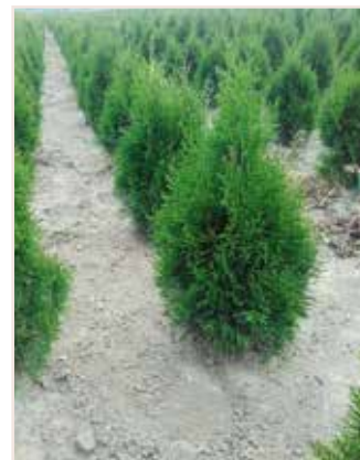
Thuja occidentalis Brabant