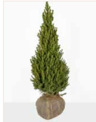
Picea glauca Conica

Immergrün und immerschön: Mit Topfbäumen gelingt eine natürliche Grundstücksabgrenzung und zuverlässiger Sichtschutz. Die Baumschulpflanzen liefern wir auf Paletten oder in CC-Containern direkt mit eingenetzmtem Wurzelballen. Je nach Vorliebe bieten wir von grünen über gelbe bis hin zu blauen Nadelbäumen alles, um höchsten Ansprüchen gerecht zu werden. Auch in großen Stückzahlen kommen die Balties-Bäume termintreu und in höchster Qualität bei den Endkunden an. Das macht unser Unternehmen zu Ihrem idealen Ansprechpartner.