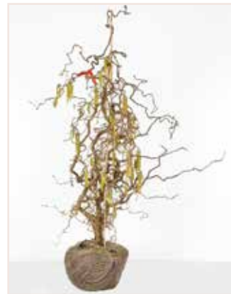
Corylus avellana Contorta