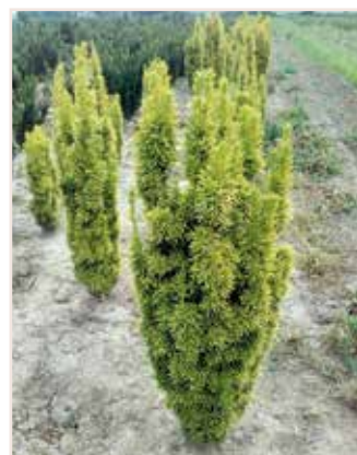
Taxus baccata fastigiata Aurea